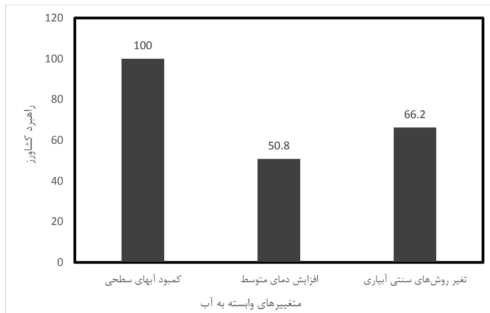
شکل ۲- تاثیرات زیست محیطی وابسته به آب

یکی از تاثیرات زیان‌بار خشکسالی بر محیط زیست کاهش سطح آب‌های زیرزمینی و تاثیر طولانی مدت کیفیت آنها است (Olsson et al. , 2009). باغداران منطقه درک قابل قبولی به‌لحاظ تاثیرات خشکسالی بر محیط زیست داشته‌اند، آن‌ها دریافته‌اند که با گرم شدن زمین شدت تبخیر افزایش یافته و نیاز محصول کشاورزی به آب بیشتر می‌شود. از سوی دیگر در محصول پسته تامین نیاز سرمایی درخت پسته برای گذراندن یک دوره رکود در زمستان الزامی است (جوانشاه و همکاران، ۱۴۰۲). ۱۰۰ درصد کشاورزان خشکسالی را بر شاخص کمبود آب‌های سطحی و ۵۰/۸ درصد از آن‌ها افزایش