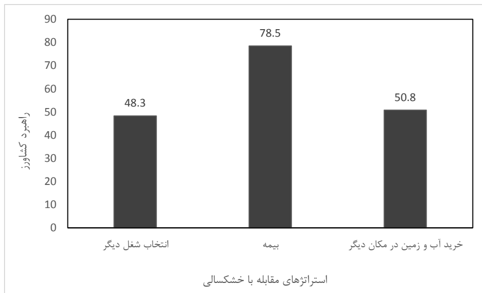
شکل ۳- استراتژی‌های کشاورز در مقابله با خشکسالی

کشاورزی باغی استان نیاز است (دهقان و همکاران، ۱۳۸۸). لذا یکی از راهبردهای مقابله با خشکسالی در مدیریت باغات پسته تغییر روش‌های سنتی آبیاری است. ۶۶/۲ درصد از پاسخ‌دهندگان تغییر روش‌های آبیاری سنتی را از راهبردهای مقابله خود با خشکسالی بیان نموده‌اند و از طریق اتخاذ تکنولوژی‌های جدید سعی دارند که خسارت ناشی از خشکسالی و کمبود آب را کاهش دهند (Azizi et al., 2022). روش‌های نوین آبیاری نسبت به روش‌های سطحی در صورت طراحی و اجرای صحیح