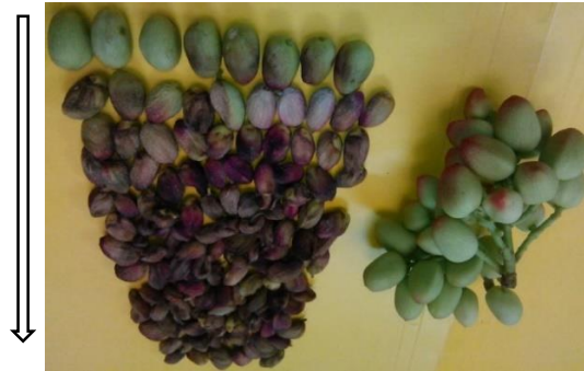
شکل ۱- مراحل پیشرفت عارضه ریزش در مقایسه با میوه‌های سالم در پسته کله قوچی.

در این پژوهش مشخص شد فرآیند ریزش با تغییرات ظاهری در پسته از جمله چروکیدگی پوست میوه، قهوه‌ای و سیاه شدن میوه همراه است. کلیه این تغییرات طی یک فرآیند زمان بر صورت می‌گیرد. میوه‌های عارضه‌دار، زمانی ریزش می‌نمایند که جنین کاملاً از بین رفته باشد (شکل ۱).